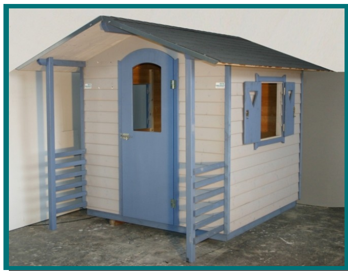
Anstrich: nur außen mit Impranol (Ölhaltige Lasur) Abb. zeigt Lichtgrau & Taubenblau

Dacheindeckung mit Bitu-Schindeln im Paket, einschließlich Unterdachbahn. Beschläge und Schrauben sind beigelegt.